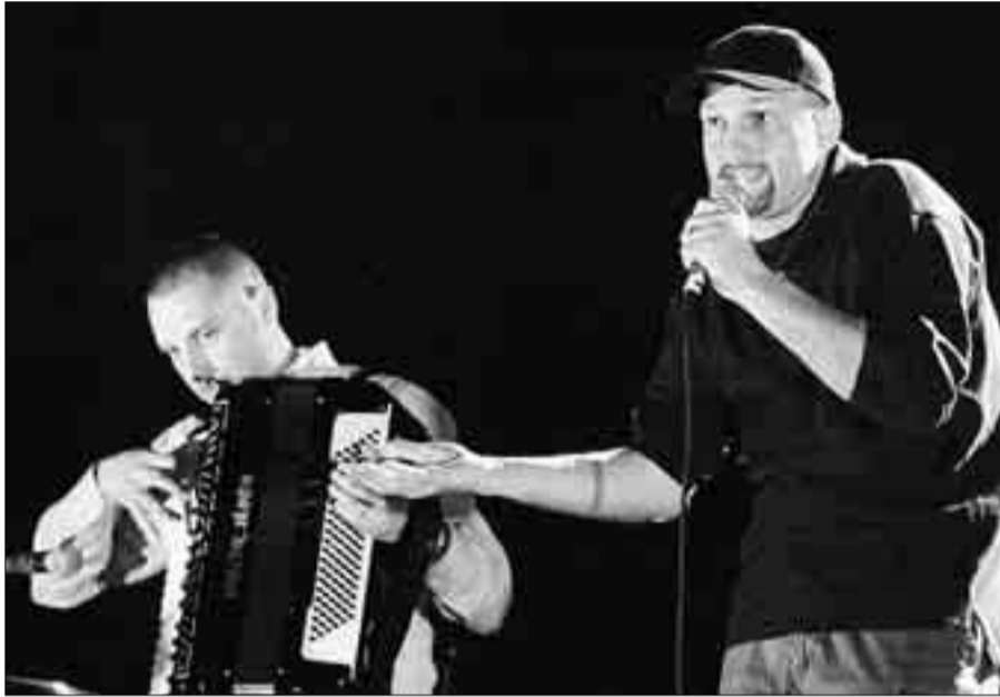
CANTANTI. Sopra e sotto, due momenti della serata di sabato

Platea piena infatti al Teatro Sociale per i dieci protagonisti della serata e anche per il Van de Sfröss l'ospite d'onore. Sul